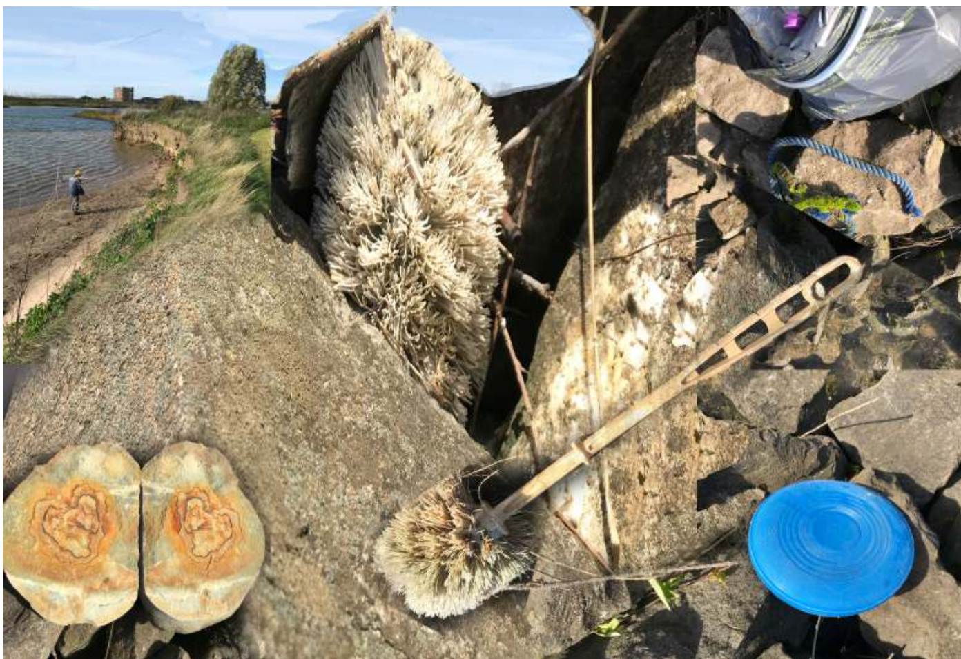
Het meest uiteenlopende plastic vuil viel te ruimen.