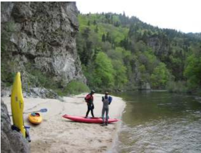
Allier, zijrivier van de Loire.

Ik voer in de bovenloop vooral over wildwater van de Allier, de andere bronrivier. De middenloop en de benedenloop zijn rustige brede stromen veelal in een onbedorven natuur. Er zijn heel weinig hindernissen en geen scheepvaart. Goed voor lange, ontspannen trektochten. Ik voer veel tussen Saumur en Angers, het westelijk deel van de "Kastelen langs de Loire".