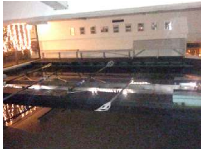
Een conditieruimte om jaloers op te zijn.

Na de maaltijd een korte wandeling naar het roeicentrum. Dat is vanaf de straat nauwelijks zichtbaar, want het ligt onder de kade en de weg. Bij de brug een trap naar beneden naar een vlot van wel vijftig meter. Er zijn loodsen voor de boten, dan een indoor-roeifaciliteit en vervolgens de ruimtes van het roeicentrum zelf: kleedkamers, douches en een ruime bar. Uitstekend geoutilleerd. Jaloersmakend vond ik de indoor-roeifaciliteit. Tussen twee steigertjes ligt een vierpersoons die naar believen voor boordroeien of skullen kan worden geriggerd. De roeiers kunnen hun inspanningen bekijken op spiegels, ze kunnen gefilmd worden