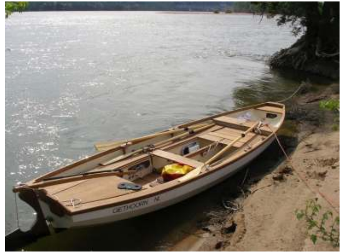
Zeilboot als roeiboot.

Vanaf Saumur (waar een roeiclub is) ligt er in de zomer betonning. De vaargeul is smal en slingert sterk, leuk werk voor de stuurman van een echte roeiboot. Tussen Angers en Nantes ligt een permanente betonning, er zijn kribben en de rivier is toegankelijk voor grote