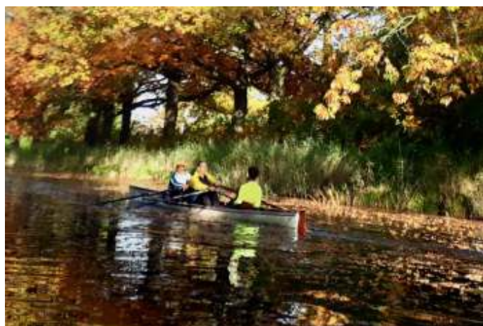
Varen in herfst sfeer. Hoe prachtig kan het zijn?

Plannen om het Apeldoorns Kanaal, van Dieren tot aan Hattem, weer bevaarbaar te maken voor motorboten, om de sluizen en bruggen weer te gaan bedienen en om het probleem van de lage vaste brug in de