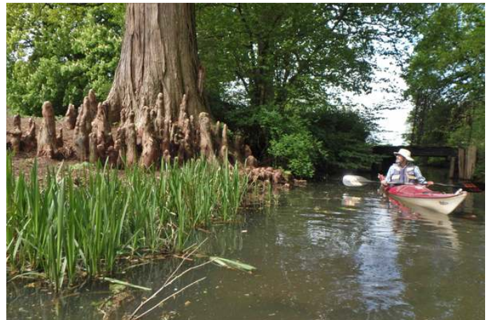
Tijdens een van de toertochten werd deze boom met bijzondere boomwortels gespot.