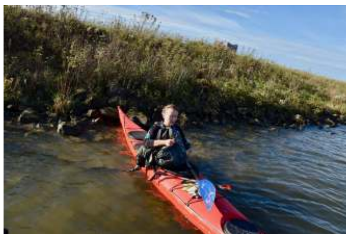
'Hebbes', dacht Fany, maar wat dacht zij gevangen te hebben? Het wilde maar niet loskomen.