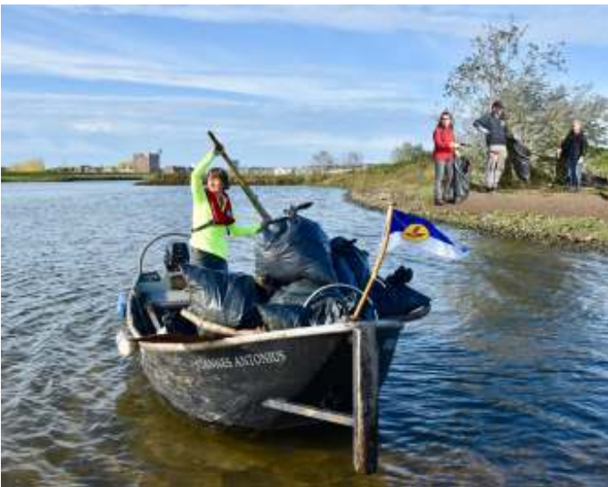
Aan het einde toch een boot vol rotzooi.