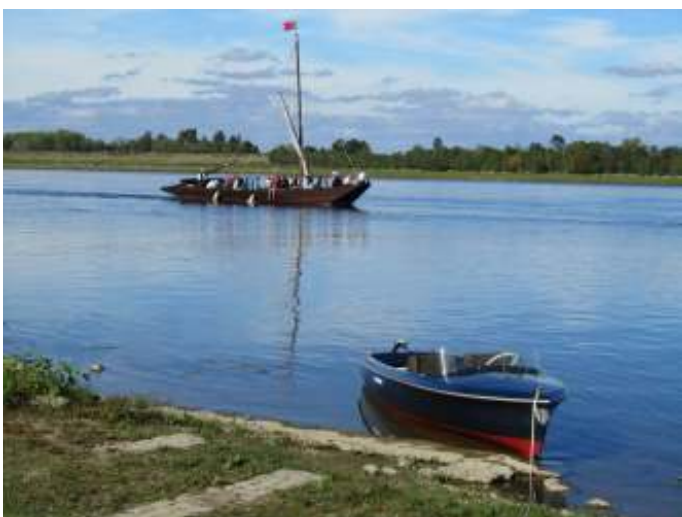
Onze toerboot en oud vrachtschip.