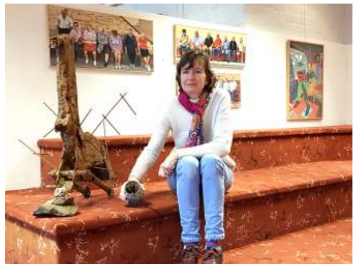
En zo wordt een roestig stuk brommer 'Schone Rijkunst'