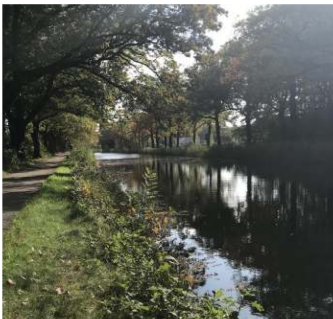
Langs het Apeldoornse Kanaal. Komt hier ooit nog wat reuring?