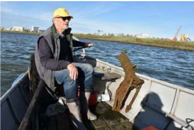
Was het een brommer of zat er meer in?