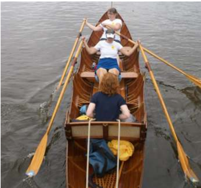
Voor nauwe doorgangen wel 'slippen' is het devies. Rechts: vlak voor de start van de wedstrijd.