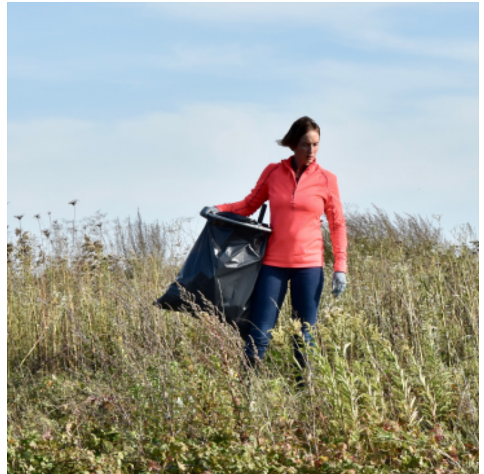
Speuren en opbeuren.