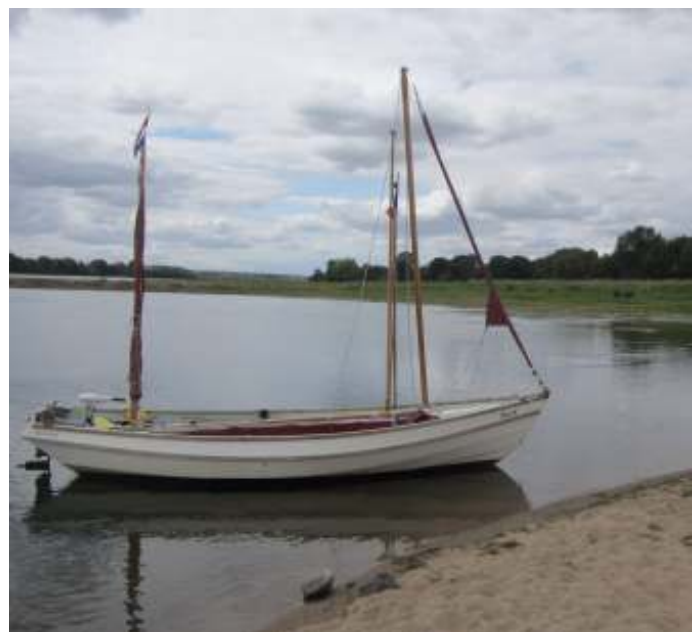
Kribben beneden Angers.

Ik zeilde regelmatig korte stukjes tegen de stroom van 4 km/uur op, wat mogelijk is met goede westenwind. Eenmaal voer ik vlak naast een aantal nagebouwde traditionele zeilschepen die de motor gebruikten op weg naar een festijn op het water. Over en weer bekeken we elkaar met veel belangstelling, intussen druk de diepte peilend want de rivier was daar breed en er moest naar de geulen gezocht worden.