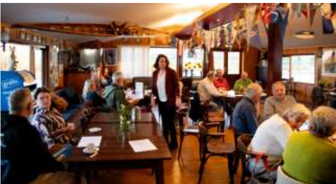
Magere opkomst op de Ledenraad, maar genoeg stof om het over te hebben. Na afloop een gezamenlijk drankje bij de bar.