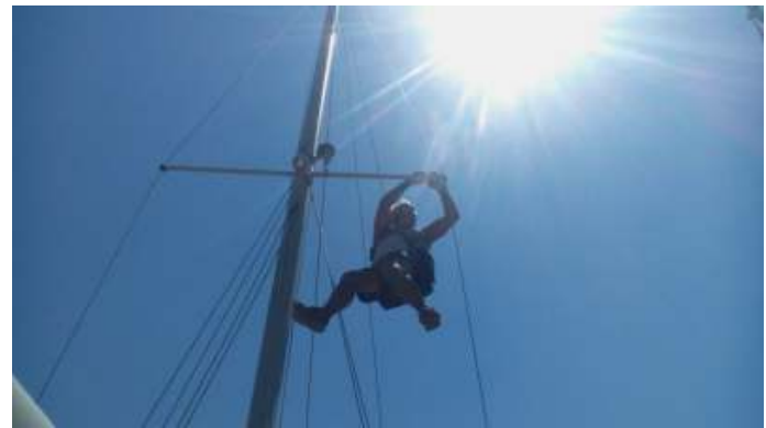
Uiteraard doe je dit bij rustig weer.

een dingetje met een 30 pk dieselmotor. De wind was inmiddels opgelopen naar de 65 knopen (windkracht 12 op de schaal van Beaufort) of met windstoten van nog meer.