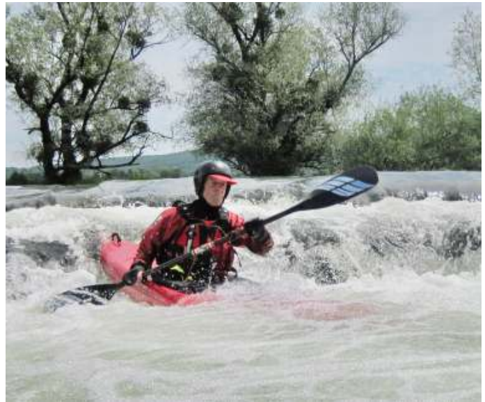
Op de Loue in de Jura

“Ruim 60 jaar geleden werd ik persoonlijk lid van de Nederlandsche KanoBond omdat er toen geen kanovereniging in mijn woonplaats Utrecht was. Ruim 30 jaar geleden werd ik lid van Jason. Mijn eerste tocht was van Doornenburg naar Jason, bij het hoogwater in 1995 toen de dijken bijna doorbraken.