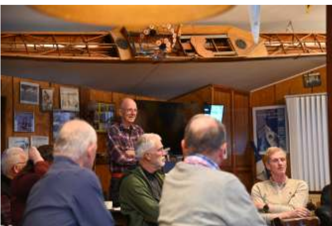
Ben zoekt opvolging voor hem als deelnemer van de kascommissie voor de ledenraad.